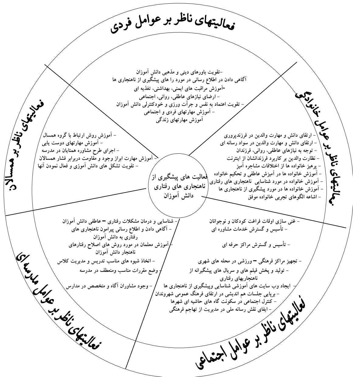
نمودار ۲. راه کارهای پیشگیرانه از ناهنجاری‌های رفتاری دانش‌آموزان

روان‌شناسی و جامعه‌شناسی است. کردزنگنه (۱۵) در یافته‌های خود گزارش کرد دانش‌آموزانی که دارای دوستان ناباب بودند، بیشتر در معرض رفتارهای ناهنجار قرار داشتند. شاطریان و اسمی جوشقانی و نوریان آرانی (۱۶) بدین نتیجه رسیدند که بیشترین تأثیر متغیرهای مستقل به‌ترتیب بر ناهنجاری‌های رفتاری دانش‌آموزان عبارتند از: دسترسی به منابع و امکانات، عملکرد جامعه، معدل تحصیلی، عملکرد جامعه، پایگاه اجتماعی، عملکرد خانواده. در پژوهش نوابخش و واحدی (۱۷) بیان شد کم‌بودن حمایت از سوی والدین و کم‌بودن کنترل از سوی معلم و کم‌بودن اعتماد بین اشخاص با رفتار بزهکارانه همبستگی مثبت دارد و می‌تواند از عوامل مؤثر در بروز ناهنجاری در دانش‌آموزان باشد. سرهنگ‌زاده و ظروفی (۱۸) در مطالعه خود در یافتند بین عملکرد خانواده، دینداری، جنسیت،