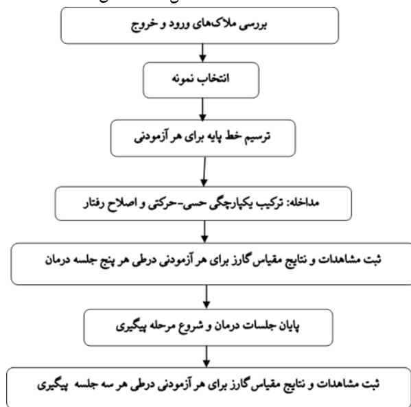
شکل ۱. مراحل و روند اجرای پژوهش

– در تمام مراحل فوق با مشورت مادر، خوراکی محبوب کودک مشخص شد و به عنوان جایزه در اختیار کودک قرار گرفت. – کودک در جلسات اول بعد از هر رفتار درست جایزه می‌گرفت و کم کم فاصله دریافت جایزه بیشتر شد. – تقریباً از حدود جلسات پنج و شش به بعد رفتارهای قالبی کاهش پیدا کرد. مادران آزمودنی‌ها هم گزارش کردند که تعداد دفعات انجام رفتار در خانه هم کمتر شده است. روند جلسات پژوهش حاضر در شکل ۱ مشخص شده است.