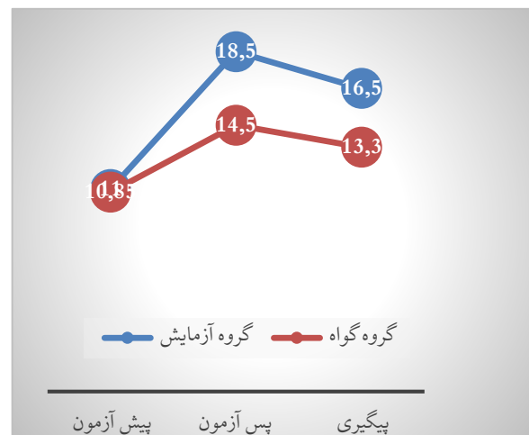
نمودار ۱. میانگین کارکردهای خواندن گروه‌های آزمایش و گواه در سه زمان