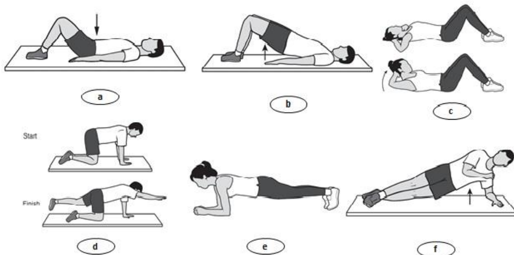
شکل ۲. تمرینات تقویتی؛ (a): کشش شکم به داخل در وضعیت طاق‌باز با زانوی خم، (b): پل‌زدن در وضعیت طاق‌باز، (c): کرانچ شکم، (d): بالا آوردن دست و پای مخالف در وضعیت چهار دست‌وپا، (e): پل‌زدن رو به شکم، (f): پل‌زدن در وضعیت پهلو

برای تجزیه و تحلیل داده‌ها از روش‌های آمار توصیفی و استنباطی استفاده شد. در سطح توصیفی از مشخصه‌های آماری نظیر میانگین، انحراف معیار و در سطح آمار استنباطی از آزمون تی وابسته (درون‌گروهی) و تی دو گروه مستقل (بین‌گروهی) استفاده شد. (نسخهٔ ۱۹) استفاده شد.